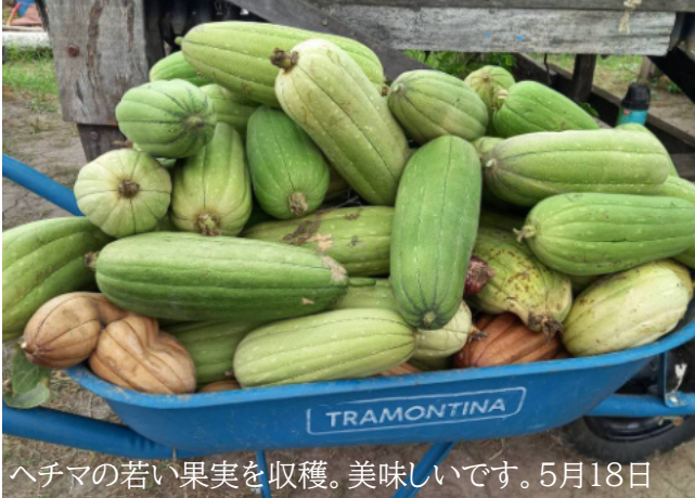
ヘチマの若い果実を収穫。美味しいです。5月18日