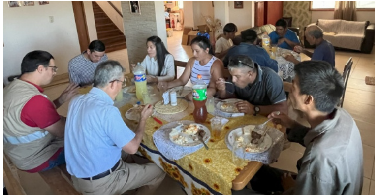
●放流式典を終えて、楽しく食事会。パクーが美味しい。