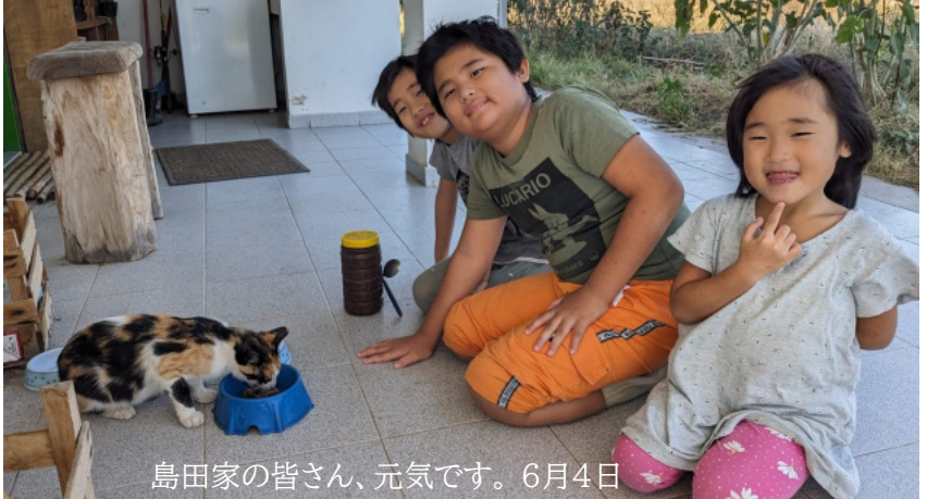
島田家の皆さん、元気です。6月4日