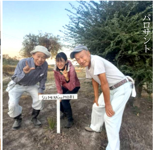
ここを「住みかの森」と命名。6月10日