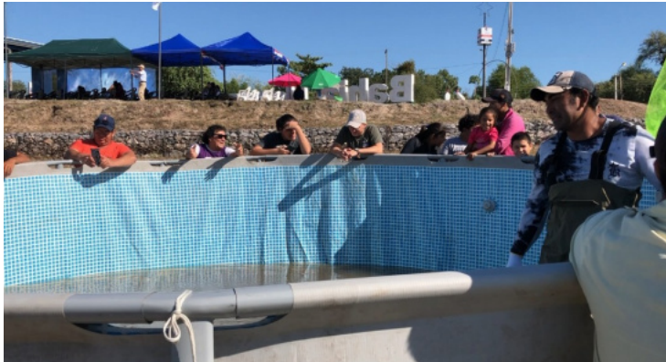
●放流前の稚魚を入れたプール、興味津々の子どもたち。