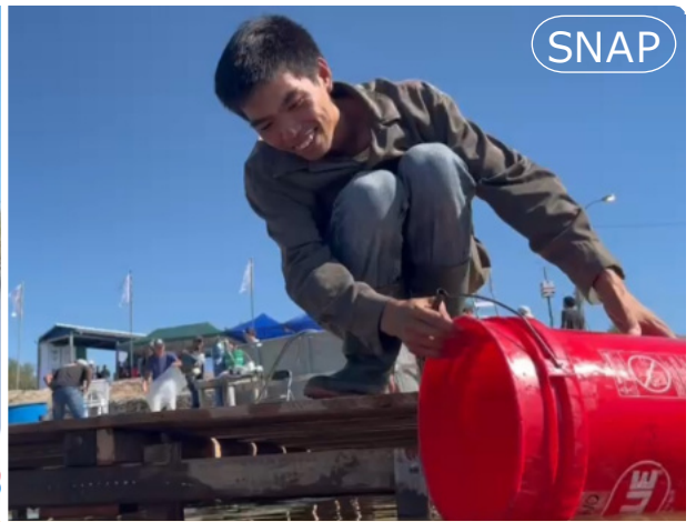
●稚魚担当のチャパボラ生が喜びの放流。6月5日