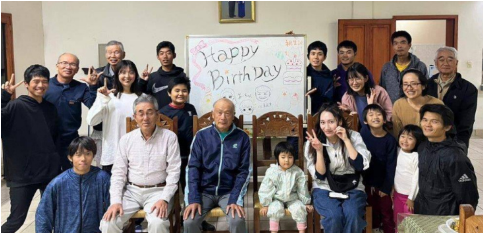
4月・5月の誕生日会。ケーキとギターと歌で楽しく祝いました。5月25日