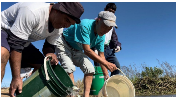
●放流式より一足早く、レダで稚魚を放流しました。6月3日